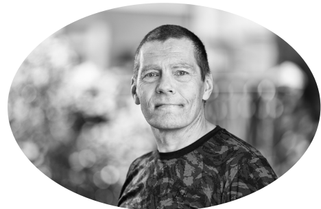
Kesto: Yksi luentokerta

Koulutus lisää tietotaitoa ADHD- tai Asperger-oireisen lapsen elämästä niin kotona kuin koulussakin. Koulutuksessa tuodaan yhteisen keskustelun ja pohdinnan kautta esille arjen työkaluja ja toimintamenetelmiä, jotka edistävät erityislasten esteettömyyttä, osallisuutta ja yhdenvertaisuutta koulussa. Lisäksi tarjotaan tietoa oppilaan tarkkaavuuden ja toiminnanohjauksen tukemisesta sekä strukturoinnista. Näkökulmana on joko ADHD- tai Asperger-oireisto. Kyseessä on toimintamalli, joka voidaan soveltaa paikallisesti.