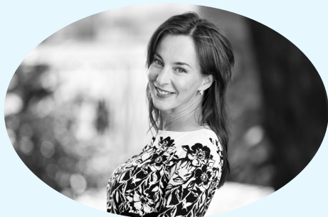
Kesto: Yksi luentokerta

Materiaali on suunnattu alakoululaisille, mutta sitä voi soveltaa myös nuoremmille ja vanhemmille lapsille ja nuorille sopivaksi. Materiaalista hyötyvät erityisesti kommunikointirajoitteiset oppilaat.